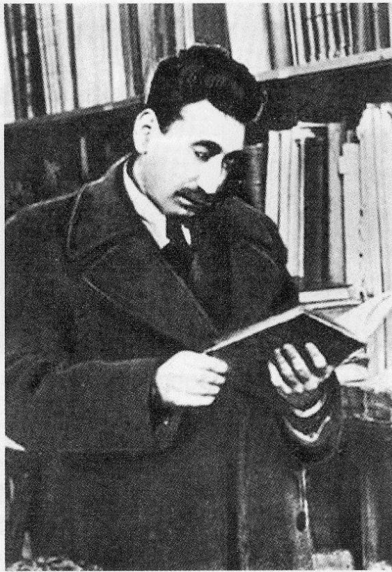
Життя серед книг