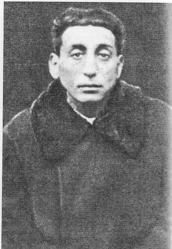
В евакуації. 1941 р.