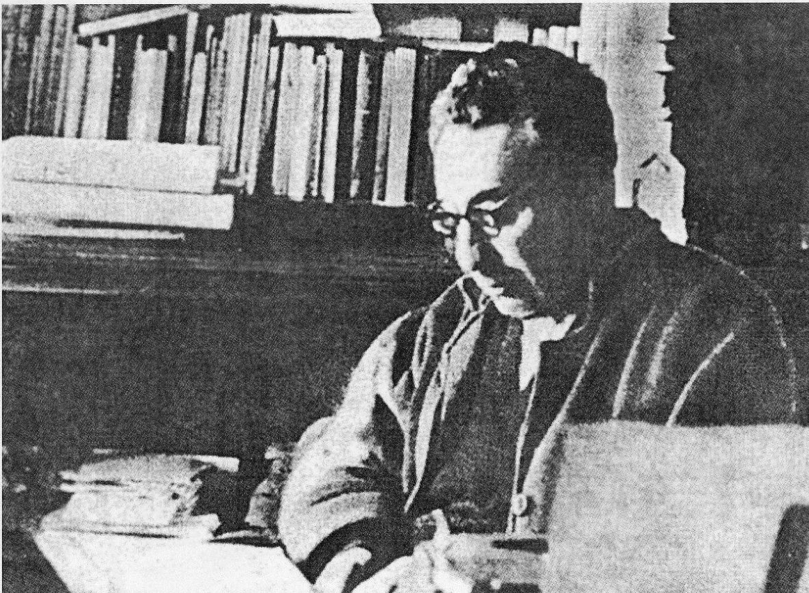
Професор за роботою