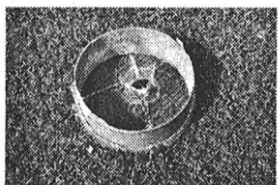
№ 1/Глушко – 1996

«Ситечко» для ловлі в'юнів Дата вигот. – 80-ті рр. ХХ ст. с. Ганівка Народицького р-ну Житомирської обл. 15 серпня 1996 р.