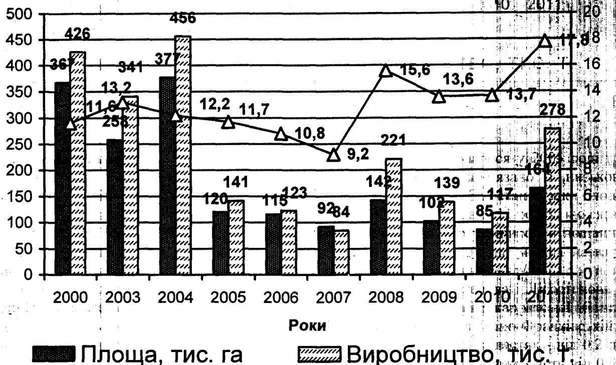
рис.2 Динаміка виробництва проса в Україні

Суттєве збільшення урожайності і валових зборів зерна круп'яних культур, і проса також, є актуальним завданням не тільки в Україні, але і всьому світу, де з-за розриву продовольчої кризи, вирішення якої частково здійснюватиметься споживанням відносно дешевих крупів, експортером яких може бути наша держава. Вирішити цю проблему можливо шляхом впровадження у виробництво сортів проса зі стабільно високим рівнем врожайності і показниками якості зерна і крупів з дотриманням сучасної сортової технології вирощування з урахуванням всіх ґрунтово-кліматичних умов зони і потреб сорту.