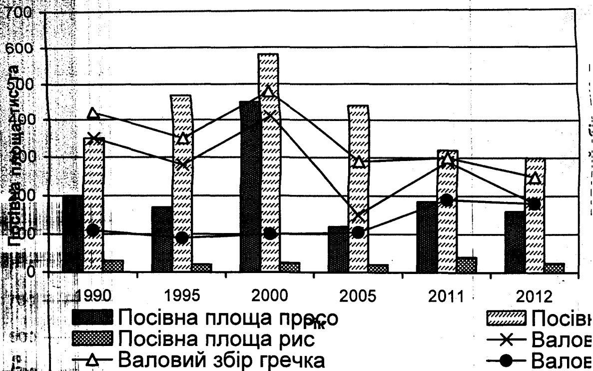
Рис. 1. Посівні площі та валові збори круп'яних культур в Україні у 1990–2012 роках

Просо в аграрному секторі України ніколи не займало провідної ролі серед сільськогосподарських культур. Але воно було і залишається в структурі посівних площ. Це одна з основних круп'яних культур України, цінність якої визначається практично безвідходним використанням продуктів переробки в харчовій, кормовій, фармацевтичній, мікробіологічній, промисловій галузях виробництва, а також можливістю вирощування у післязливних та післяукісних посівах і як страхова культура для пересіву озимих. У складі грона міст білка становить 12 %, крохмалю 81 %, жиру 3,5 %, клітковини 1-2 %. Зерно багате на мінеральні речовини, мікроелементи, вітаміни В1, В2, В5, В6, С, каротиноїди та інші фізіологічно активні елементи.