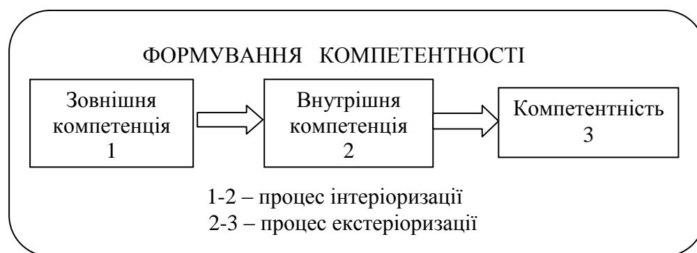
Рис.1. Схема формування компетентності

Таким чином, навчально-професійну діяльність з формування компетентності фахівця можна зобразити у вигляді наступної схеми: