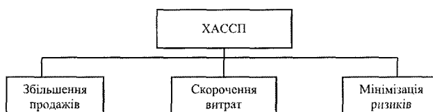
Рис. 1. Система ХАССП як бізнес-інструмент

Наразі системи управління безпечністю харчових продуктів застосовують практично в усьому світі як надійний захист споживачів від небезпек, які можуть супроводжувати харчову продукцію. Запровадження систем управління безпечністю харчових продуктів вимагає законодавство Європейського Союзу, США, Канади, Японії, Нової Зеландії та багатьох інших країн світу.