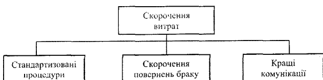
Рис. 3. Фактори які ведуть до скорочення витрат за системою ХАССП

– зменшення втрат, пов'язаних із негативними наслідками повернень продукції, харчових отруень та інших проблем безпечності харчових продуктів.