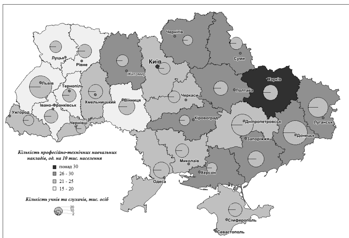
Рис. 2. Показники професійно-технічної освіти за регіонами України (побудовано на основі розрахунків за даними [3])

10 тис. осіб), поділяючи його з Кіровоградською та Полтавською областями. Високі показники кількості ПТНЗ спостерігаються також в Донецькій, Чернігівській, Херсонській, Житомирській, Сумській, Запорізькій областях (29 – 26 ПТНЗ на 10 тис. осіб). Остані місця у рейтингу регіонів за даним показником займають Тернопільська, Львівська, Рівненська, Івано-Франківська області та м. Київ (19 – 16 закладів). В середньому по Україні кількість ПТНЗ у розрахунку на 10 тис. осіб населення становить 24 заклади. Серед регіонів України лише 11 областей та м. Севастополь мають дані показники вищі за середні по країні.