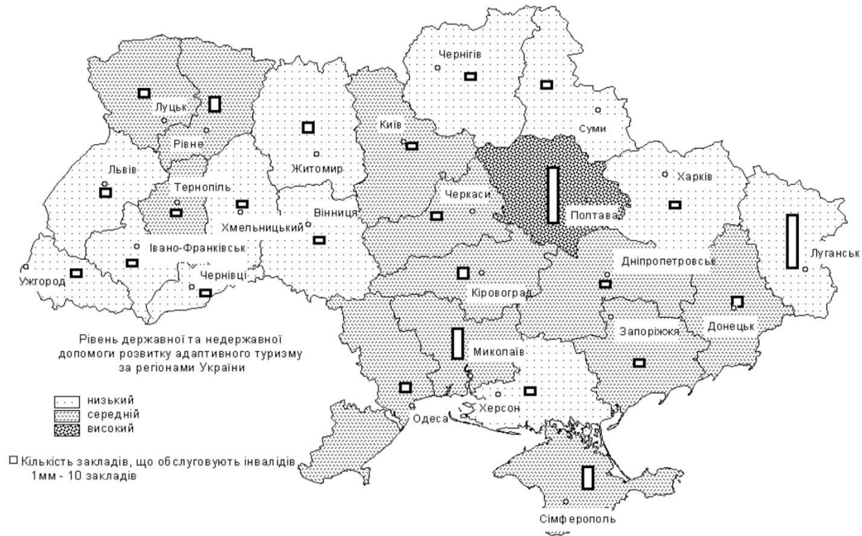
Рис. 3. Державна та недержавна допомога розвитку адаптивного туризму за регіонами України (2013 р.).