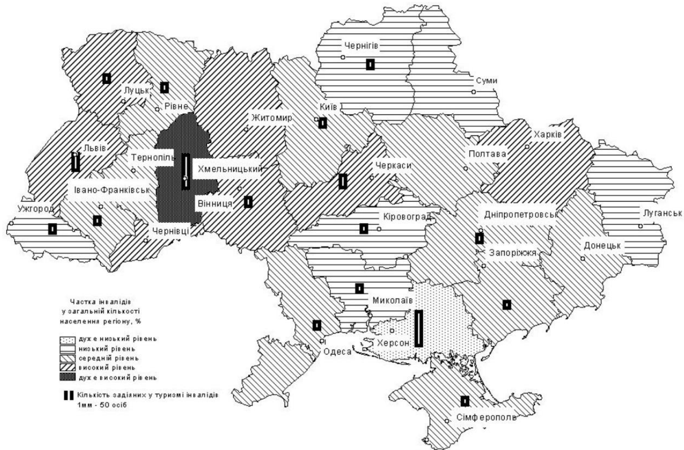
Рис. 1. Частка інвалідів у загальній кількості населення регіонів України (2013 р.).