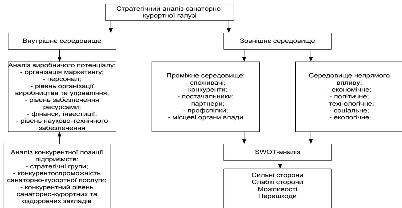
Рис. 2. Складові середовища функціонування санаторно-курортних та оздоровчих закладів (на основі [1])

У структурі діяльності галузі можна виділити три рівні середовища: внутрішнє, середовище завдань (проміжне) та зовнішнє (рис. 2). Внутрішнє середовище є сукупністю факторів, що формують довгостроковий прибуток і знаходяться під безпосереднім контролем власників, керівників, персоналу. Зовнішнє середовище включає в себе фактори, на які підприємства даної галузі не можуть впливати або їх вплив є незначним. Поміжне середовище включає фактори, на які санаторно-курортні заклади можуть впливати шляхом комунікацій.