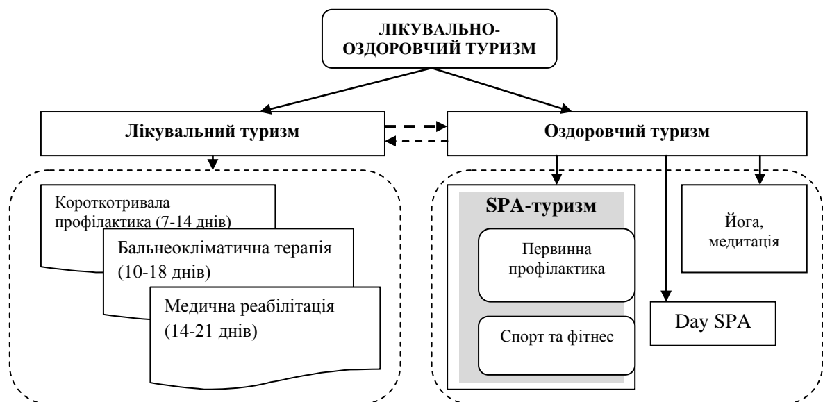
Рис. 1. Внутрішня структура лікувально-оздоровчого туризму [17]

Виклад основного матеріалу дослідження. Функціонування лікувально-оздоровчого туризму як галузі економіки забезпечується природними рекреаційними факторами та наявною інфраструктурою, відповідним персоналом та органами управління. Існують підходи до класифікації внутрішньої структури лікувально-оздоровчого туризму, які ґрунтуються на продуктовому підході (рис. 1).