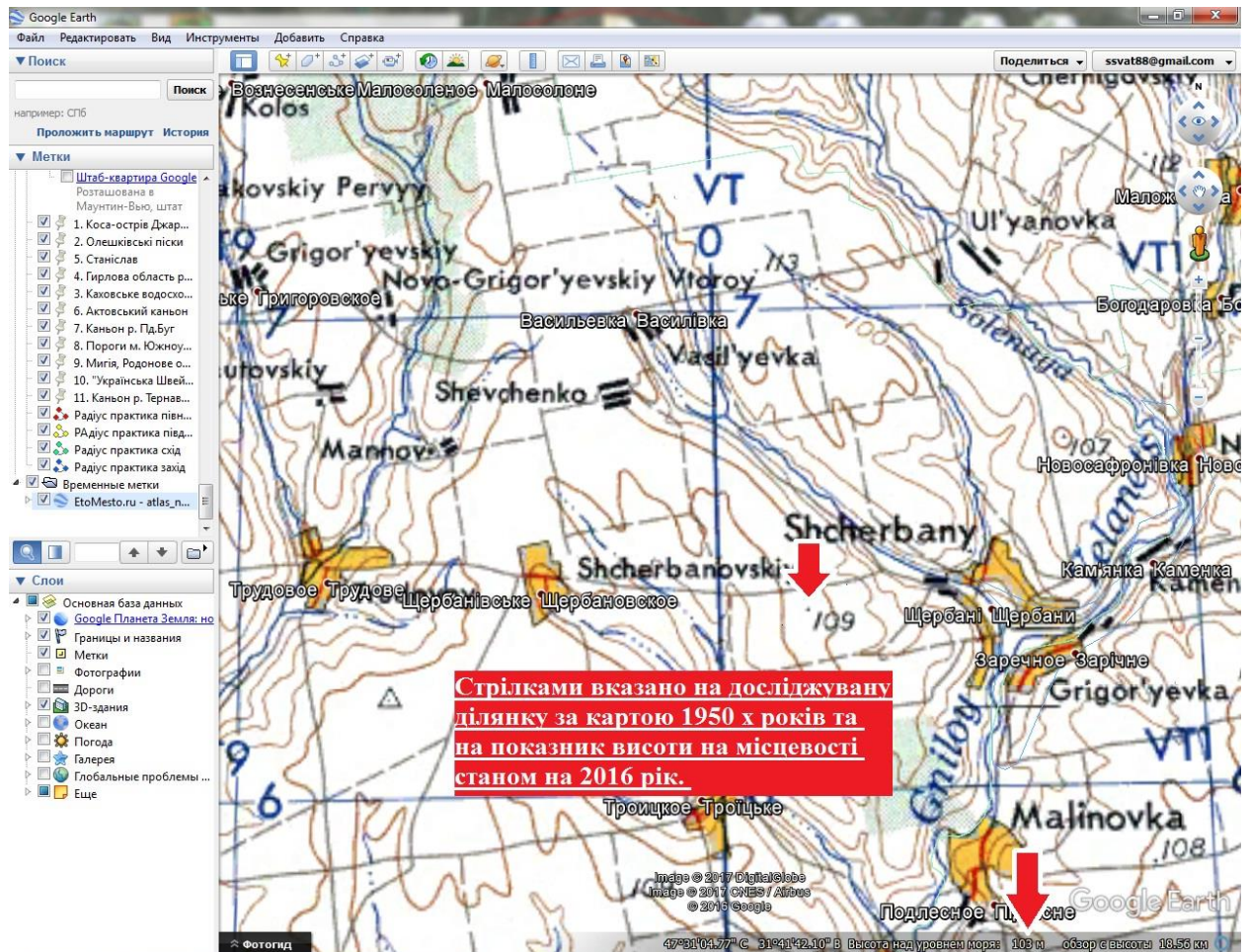
Рис. 2 Ділянка карти території Миколаївської області створеної розвідкою США у післявоєнні часи інтегрованої у Google Earth Pro [1,5]

Отже, у час інтенсивного розвитку інформаційних технології для підвищення рівня підготовки фахівців-географів і екологів необхідно використання новітніх технології у освітній і науковій діяльності, що значно спрощує, тим самим пришвидшує виконання завдань та підвищує якість отриманих результатів. Окрім результативності слід виділити також збільшення аудиторії призначення (за рахунок інформативності) та розширення міждисциплінарних зв'язків. Платформа ГІС Google Earth Pro дозволить зробити перші кроки у проведенні досліджень за допомогою ГІС та є загальнодоступною і охоплює значну аудиторію користувачів.