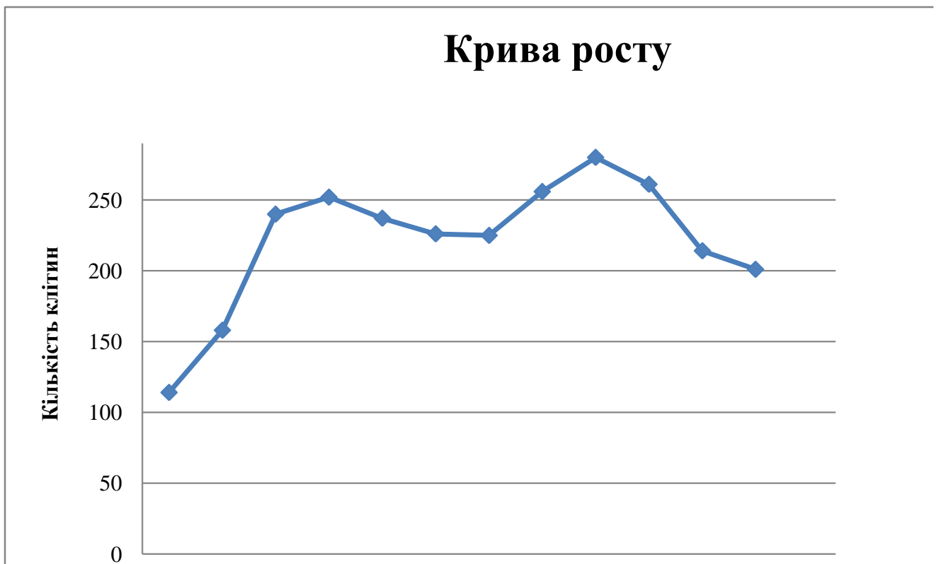
Рис. 1. Крива росту культури клітин гемоендотеліосаркоми in vitro .

У перші 13 днів у культурі тривала lag-фаза. Ця фаза характеризується активною підготовкою клітин до проліферації. Вивчення динаміки росту культури у цій фазі демонструє повільне збільшення концентрації клітин (із 143 \times 10^3 кл./мл до 158,8 \times 10^3 кл./мл). У lag-фазі відбувається зміна поверхні ядра за рахунок інвагінацій, збільшення кількості рибосом, які згруповані в полісоми, та поява численних цистерн гранулярного ендоплазматичного ретикулума, збільшується концентрація ферментів.