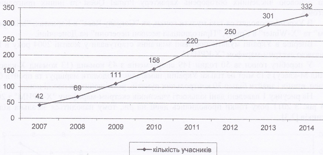
Рис.2. Кількість учасників екстрим-перегонів "Gorgany Race"

складність маршруту свідчить той факт, що виконати ці вимоги вдалося лише 6 з 14 команд.