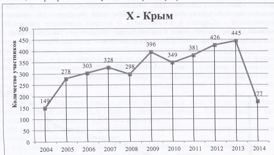
Рисунок 1. Динамика количества участников соревнований «X-Крым» за период 2004-2014 годы

За все время проведения гонки почти вся часть горного Крыма была задействована. Организаторы пытались с каждым годом внести что-то новое в преодоление дистанции и в то же время не ставить участников в узкие рамки, что и привлекало новичков и любителей, желающих испытать себя. По праву можем считать, что «Milo-рейд X-Крым» была самой технической гонкой на Украине, так как преодоление дистанции предусматривало преодоления естественных препятствий с помощью альпинистского снаряжения, которое участникам нужно было транспортировать самостоятельно.