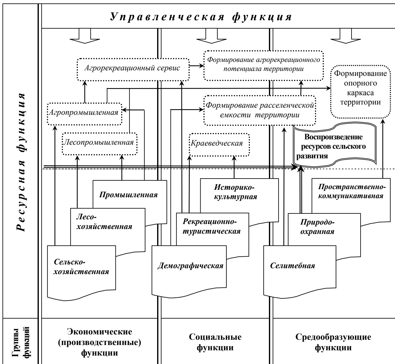
Рис. 1. Общественно-географический анализ развития функций сельской местности (разработано Д.С. Мальчиковой [5])

взаимодействия с обретением новых качеств. Так, например, объединение элементарных сельскохозяйственной и промышленной функций дает выполнение агропромышленной функции, взаимодействие рекреационно-туристической и сельскохозяйственной (агропромышленной) функций предопределяет возможности возникновения агорекреационного сервиса и т.п.