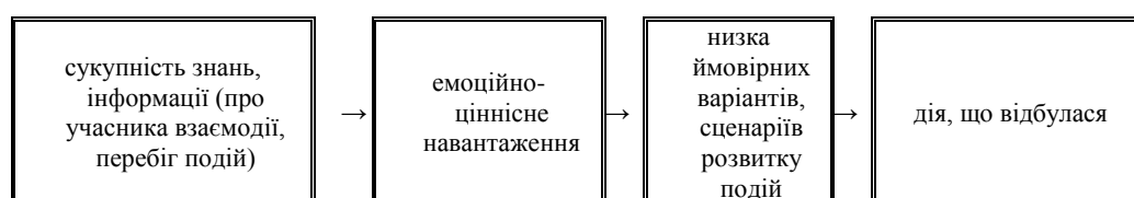
Рис.6. Механізм очікуваної дії

Неочікувані дії на зворотному шляху набувають емоційно-ціннісного навантаження, яке супроводжується інформаційним навантаженням. Відбувається коригування і уточнення інформації про перебіг подій. Оскільки у зв'язку з неочікуваними діями відбулися зміни, то відбувається доповнення цієї інформації. Соціальні очікування підлягають постійній апробації. Покажемо схематично на рис.6 механізм очікуваної дії.