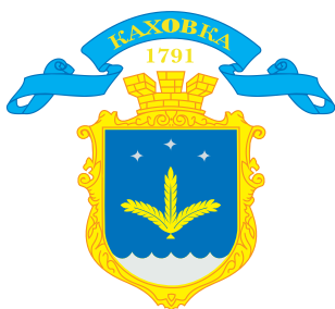
Виконавчий комітет Каховської міської ради