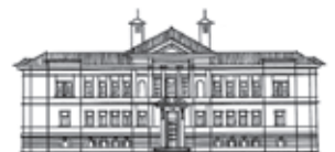
Херсонський обласний краєзнавчий музей Каховський історичний музей