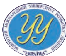
Відкритий міжнародний університет розвитку людини «Україна» Новокаховський гуманітарний інститут