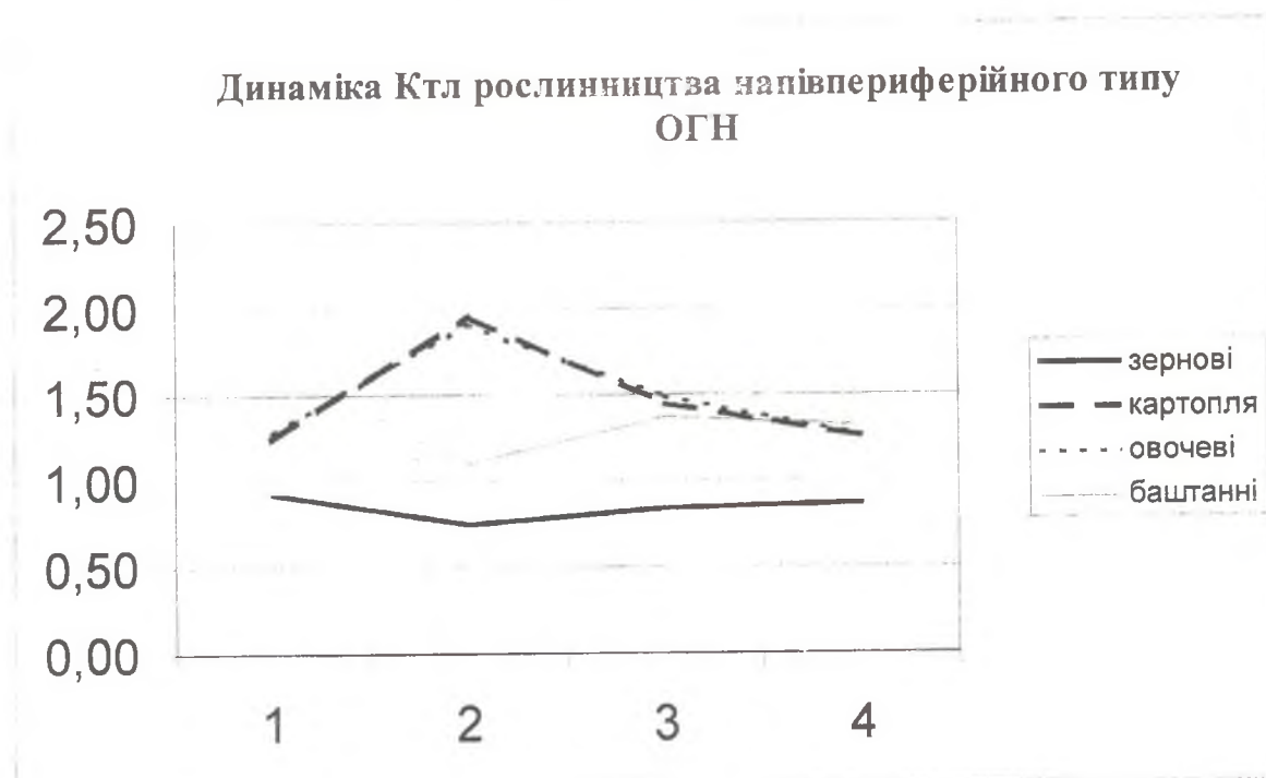
Рис. 2 Динаміка коефіцієнтів територіальної локалізації головних культур рослинництва напівпериферійного типу ОГН

Загальна тенденція змін коефіцієнтів локалізації цих культур в напівпериферійному типі – зменшення товарності і “тяжіння” коефіцієнтів до одиниці.