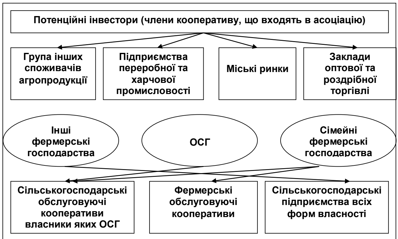
Рис. 1. Схема інтеграції сільськогосподарських товаровиробників, підприємств АПК, закладів торгівлі як основи розвитку оптових ринків с/г продукції

Завдання і методика досліджень. Створення мережі районних заготівельно-збутових та постачальницьких об'єднань сільськогосподарських товаровиробників на кооперативних засадах є основним завданням для розвитку регіональних оптових ринків свіжої сільськогосподарської продукції. Споживачами збутових кооперативів є: