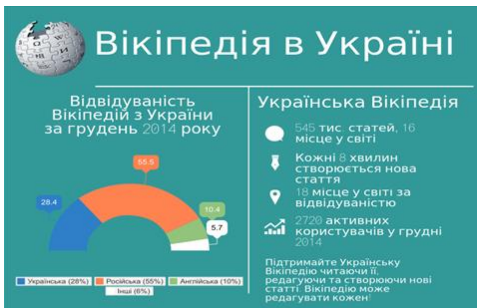
Рис. 1.1. Інфографіка для відвідувачів «Вікіпедії».

Опрацьовуючи тему «Методи і форми навчання» звертаємо увагу студентів-філологів як на традиційні підходи, так і на інноваційні нароби учителів-практиків. Зокрема, мова йде про роботу з креолізованими текстами «нової природи» (комікси, буктрейлер, мотиватор на літературну тему, постер на літературну тему, буклет, скрапбукінг, фотоколаж на літературну тему з метою популяризації конкретного художнього тексту або творчості певного автора, кардмейкінг, «дуддл» (заставка для ГУГЛа, присвячена художньому твору або письменнику), про використання інтелект-карт, гіф-анімації, плейкаста, саундтрека, прийому сторітелінгу тощо. Говоримо і про інфографіку. Вона використовувалася людством із давніх часів. Її першими зразками вважають малюнки та мапи на стінах печер. У зв'язку із сучасним швидким зростанням кількості легких у використанні інструментів для її створення, інфографіка стала доступною для широкого кола користувачів. Соціальні мережі також сприяли її розповсюдженню у всіх куточках світу. Вікіпедія подає таке її визначення: «Інформаційна графіка або інфографіка (англ. Information graphics; infographics) – це графічне візуальне подання інформації, даних або знань, призначених для швидкого та чіткого відображення комплексної інформації». Прикладом може слугувати інфографіка, розроблена в 2014 році для відвідувачів онлайн-енциклопедії «Вікіпедія» (рис.1.1).