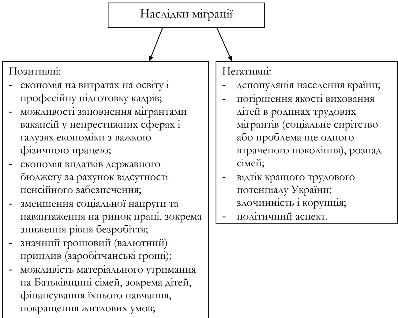
Рис. 1. Наслідки зовнішньої міграції (за даними[4]).

Міжнародна міграція породжує гострі соціально-економічні проблеми. Так додаткова конкуренція на ринку праці призводить до зростання безробіття. Крім того, масову міграцію завжди супроводжують зростання соціальної напруженості в суспільстві, конфлікти на расовому, національному та регіональному підґрунті, зростання злочинності та інших негативних явищ (рис. 1).