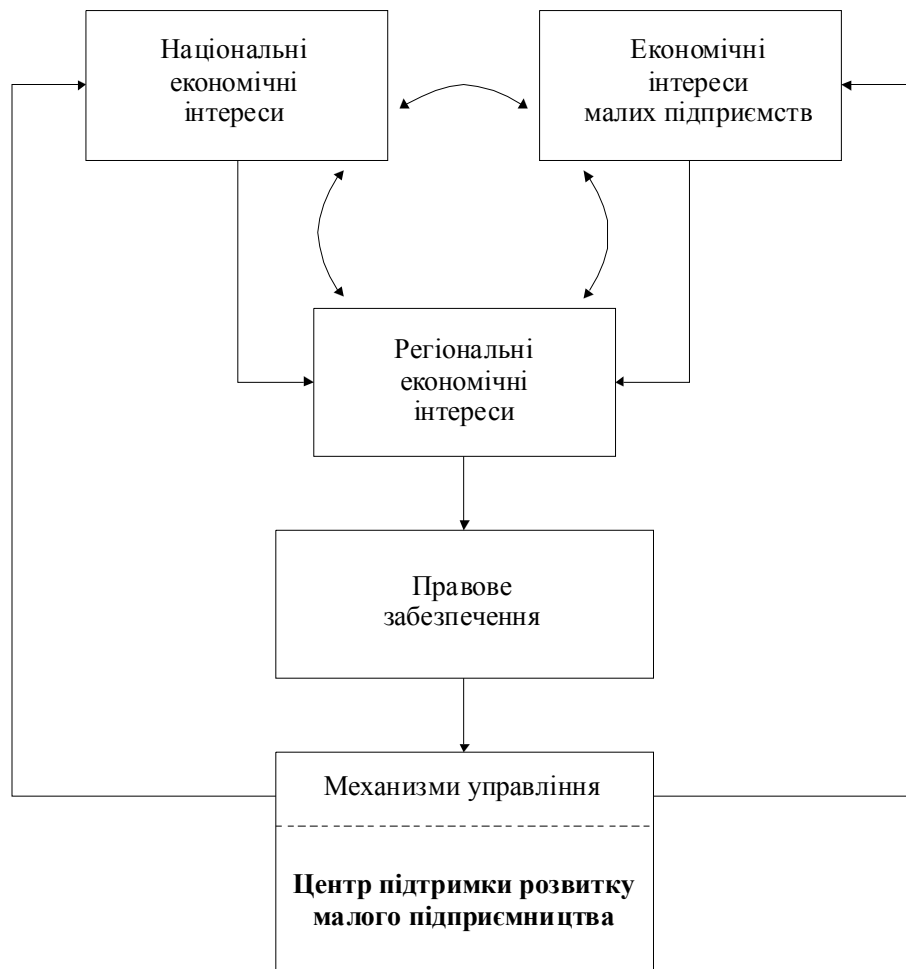
Рис. 1. Схема управління процесом адаптації економічних інтересів суб'єктів господарювання

Ця схема розкриває складну організаційно-економічну систему взаємопов'язаних економічних, правових, організаційних і соціальних чинників діючих у динамічному режимі. У блоці "механізм управління", у якості пріоритетної ланки визначено Центр підтримки розвитку малого підприємництва.