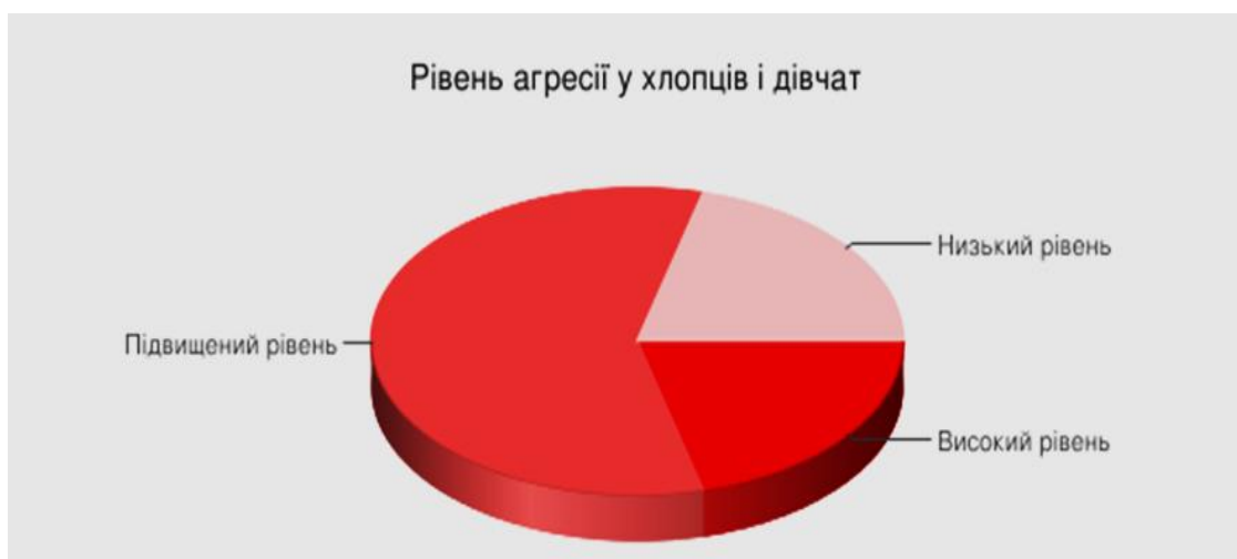
Рис.1. Результати діагностики агресивної поведінки підлітків (за тестом Басса-Дарки)

Для виявлення рівня агресії був використаний тест Басса - Дарки. Створюючи свій опитувальник науковці виділили наступні форми агресії: фізична агресія - використання фізичної сили проти іншої особи; непряма - агресія, обхідним шляхом спрямована на іншу особу або ні на кого не спрямована; роздратування - готовність до прояву негативних почуттів при найменшому порушенні (запальність, грубість); негативізм - опозиційна манера в поведінці від пасивного опору до активної боротьби проти встановлених звичаїв і законів; вербальна агресія - вираз негативних почуттів як через форму (крик, вереск), так і через зміст словесних відповідей (прокляття, погрози). Отриманий результат представлено на рис.1.