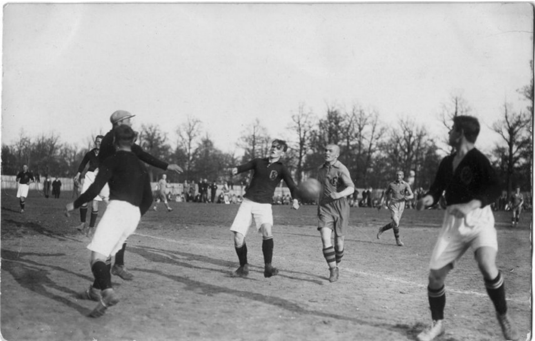
Фото 5. «Литовське дербi». Футболiсти «LFLS» проти землякiв з «Kovas» (фото 1928 р.)