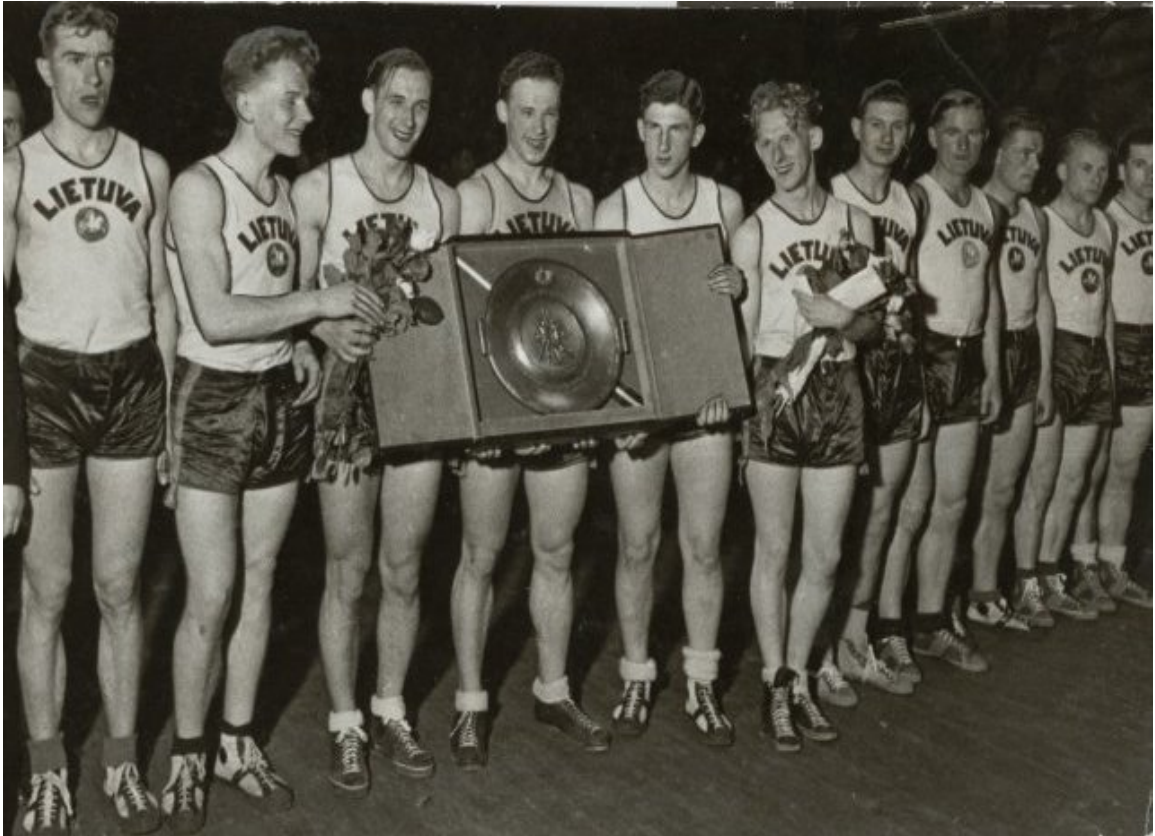
Фото 4. Литовський «кrepшiнiс» у дiї. «Сини Вiтовта» «завоювали» Європу (Фото з церемонiї нагородження переможцiв Євро 1937 р.) [6]