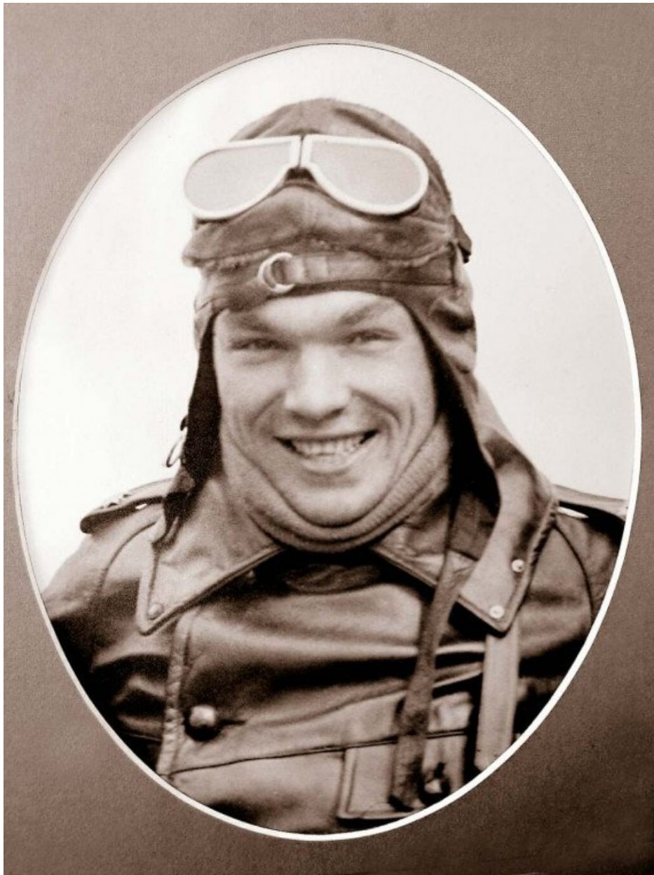
Фото 6. «Анфан террібль» Першої Республіки Ромуальдас Марцинкус. «Красунчик Ромуальдас» своєю особою «поєднував непоєднуване» – високий інтелект, цілеспрямованість та безмежну відданість «Матері Литві» з веселим фанфаронством та безпрецедентним авантюризмом. Р. Марцинкус – головний символ литовського футболу «сметонівської» доби (фото другої половини 1930-х рр.)