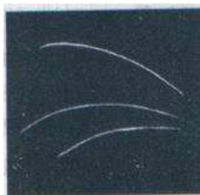
Рис. 2. Треки \alpha –частинок у камері Вільсона.