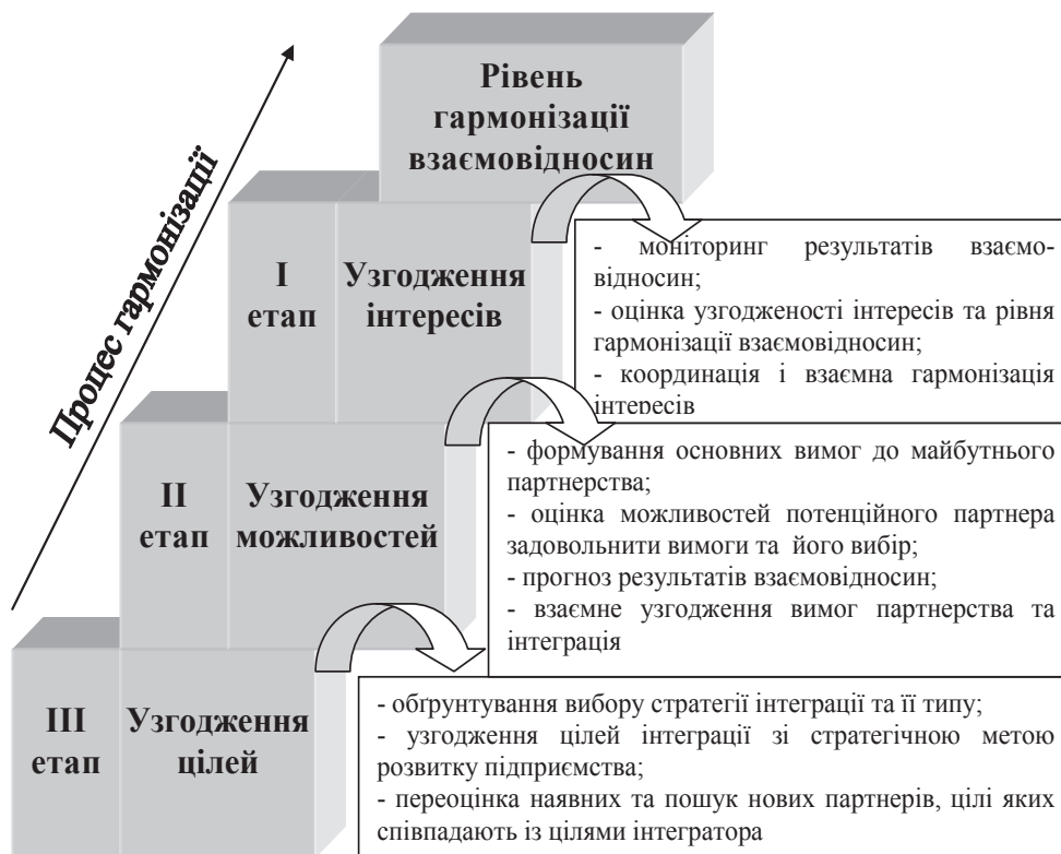
Рис. 3. Концептуальна модель гармонізації взаємовідносин учасників інтеграції [7]

Ураховуючи вищевказане, можна сформулювати таке визначення: гармонізація взаємовідносин суб'єктів інтеграції – це процес, який відображає стосунки, що складаються під час формування гармонії в економічній діяльності суб'єктів господарювання, що утворили системні відносини на основі інтеграції, шляхом узгодження їх цілей, можливостей та інтересів на основі забезпечення їх прав та задоволення пріоритетних потреб.