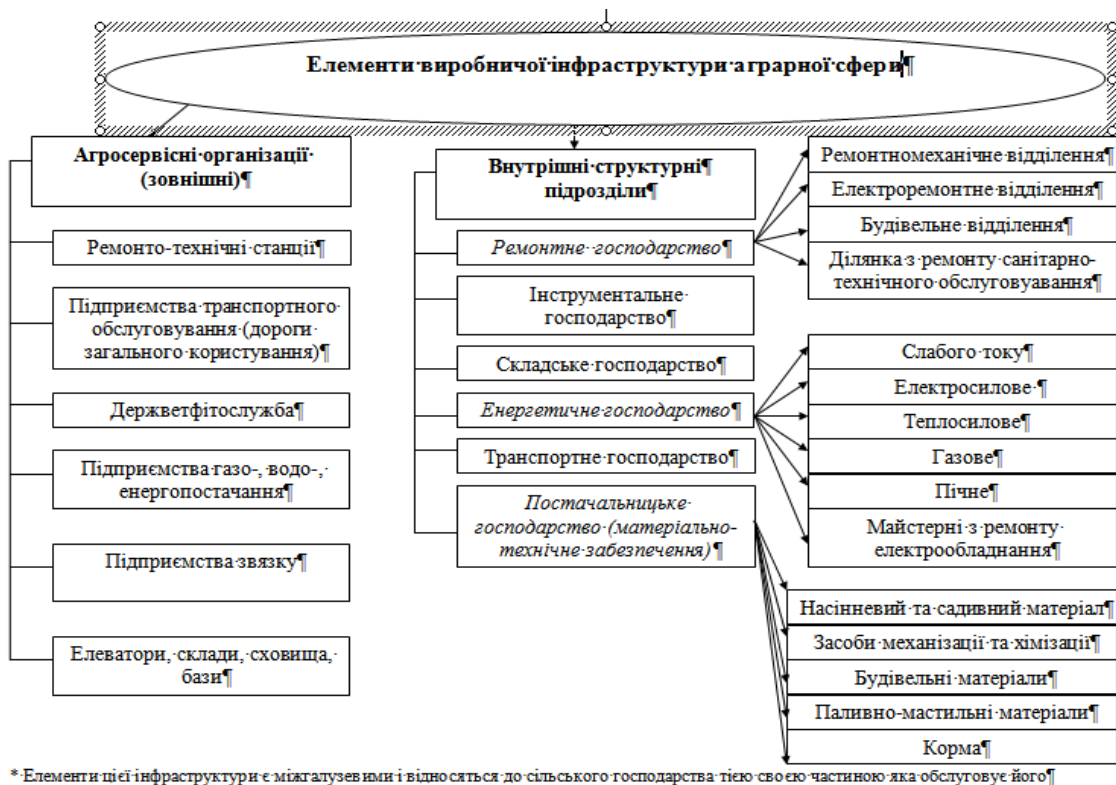
Рис. 1 . Елементи виробничої інфраструктури аграрної сфери

Теоретичний аналіз і оцінка різних класифікацій сукупності елементів інфраструктури аграрної сфери, дозволили запропонувати наступну класифікацію її соціальної та виробничої інфраструктур, представлену на рис. 1. та рис. 2.