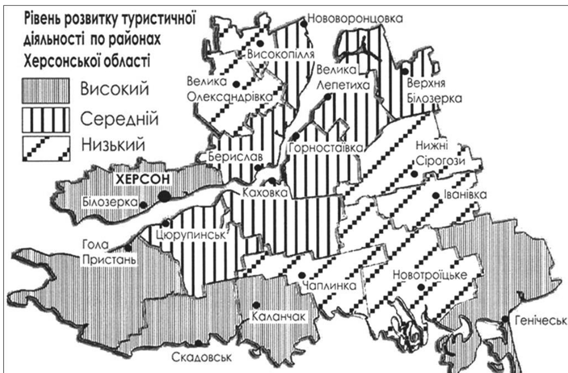
Рис. 1. Рівень розвитку туристичної діяльності по районах Херсонської області (за Я. В. Василевською)

Пояснення цьому можна шукати в особливостях територіальної диференціації туристично-рекреаційних ресурсів у межах нашого регіону, значній неоднорідності в ресурсному забезпеченні туризму та рекреації по районах Херсонської області. Дослідники умовно поділяють територію Херсонщини на три ділянки (рис. 1).